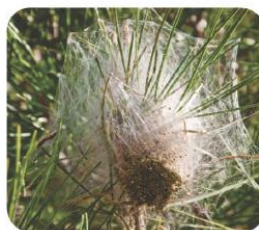
Nido de Thaumetopoea pityocampa