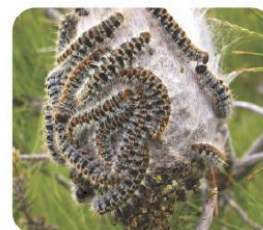
Orugas de Thaumetopoea pityocampa